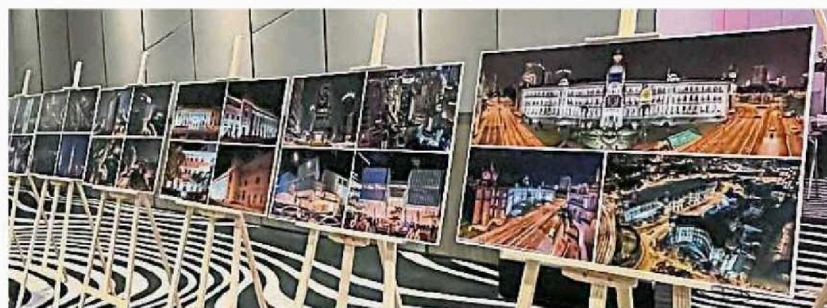
隆市建筑物夜间灯光照明的照片在颁奖典礼上展示。