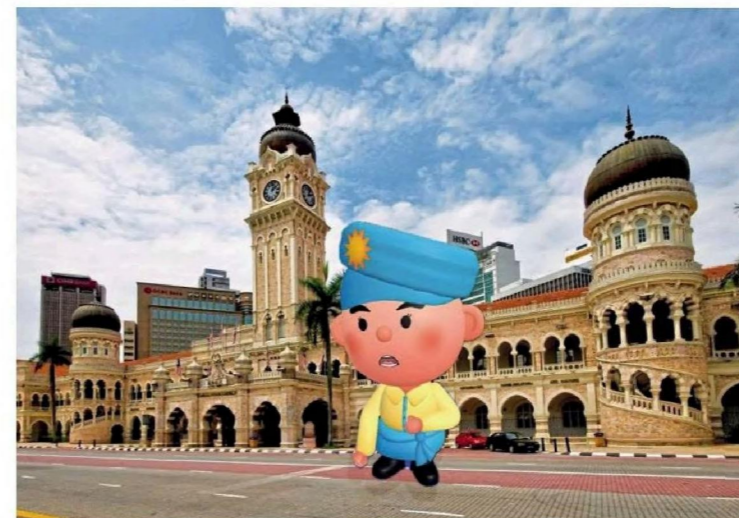
Penglipur lara avatar yang dikuasakan AI bercerita mengenai keistimewaan mercu tanda ikonik, Bangunan Sultan Abdul Samad.

Bayangkan, dalam sekelip mata sahaja aktiviti bersiar-siar di Dataran Merdeka bertukar menjadi 'buku cerita' yang menarik diceritakan oleh penglipur lara avatar dikuasakan oleh kecerdasan buatan (AI).