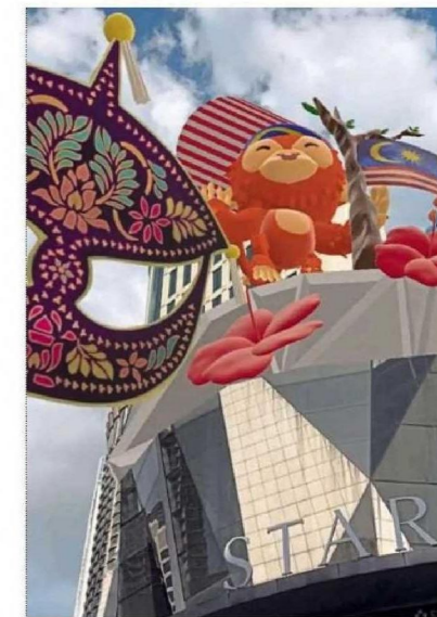
Saksikan gabungan seni tradisional dan moden berlatarkan kompleks The Starhill.