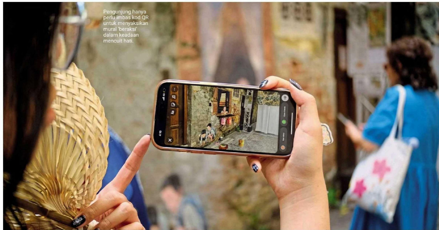
Pengunjung hanya perlu imbas kod QR untuk menyaksikan mural 'beraksi' dalam keadaan mencuit hati.