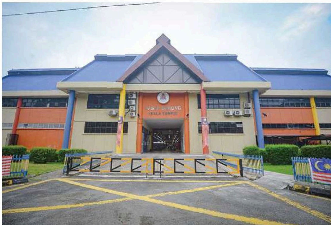
INFRASTRUKTUR jalan di sekitar PBKL juga diselenggara secara berperingkat.