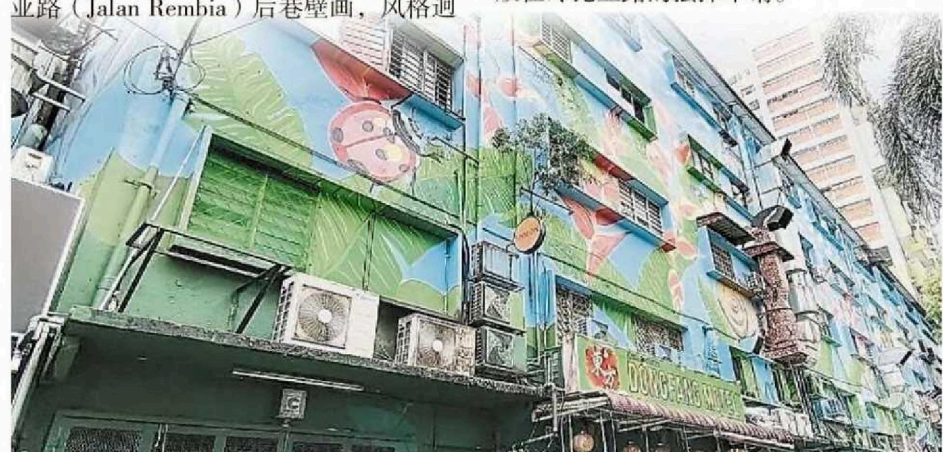
冷比亚路(Jalan Rembia)后巷壁画，出自当地商家自发性聘请艺术团队来打造，配合隆市政局携手美化首都。

有关艺术团体采纳铝复合板(ACP)作为主要素材，透过耐用质料细心打造切割大马各族舞蹈的舞姿立体剪影，创作元素涵盖中华舞龙、印度舞、杂宾舞(Zapin，盛行于柔佛的马来传统舞蹈)和马来传统舞蹈伊娘舞(Inang)。