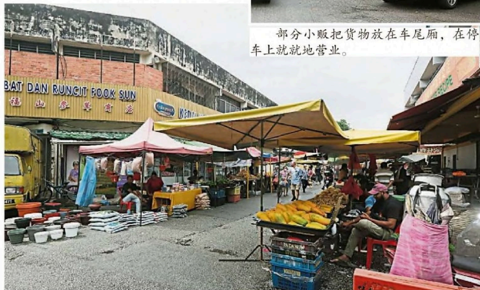
据悉，部分合法小贩以在巴刹内没生意为由而搬到巴刹外摆摊。