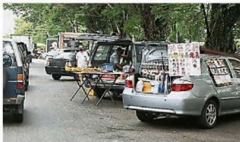
部分小贩把货物放在车尾厢，在停车上就就地营业。

他希望上述小贩停止不负责任的行为，以免面对吉隆坡市政局的严厉执法，包括吊销小贩执照。