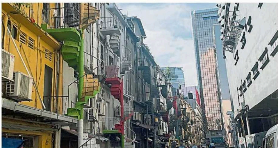
市政局计划将老旧的建筑物的墙面及楼梯漆上七彩颜色,让后巷换上新新面貌。

“服务中心也愿意给予帮忙,比如资助油漆。当然,居民也必须涉及在内,一起参与区内的提升工作。”