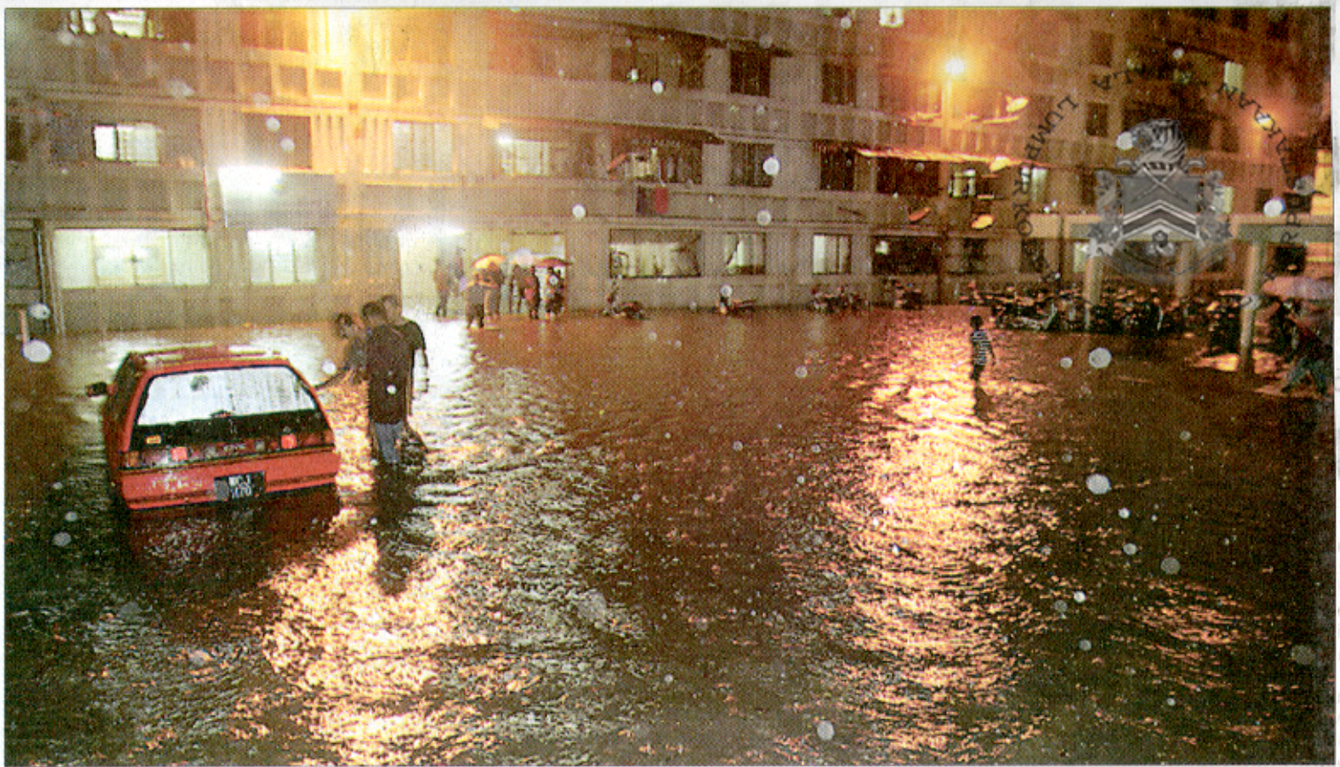
BANJIR kilat turut dialami oleh penduduk rumah pangsa Pekeliling, Jalan Tun Razak.