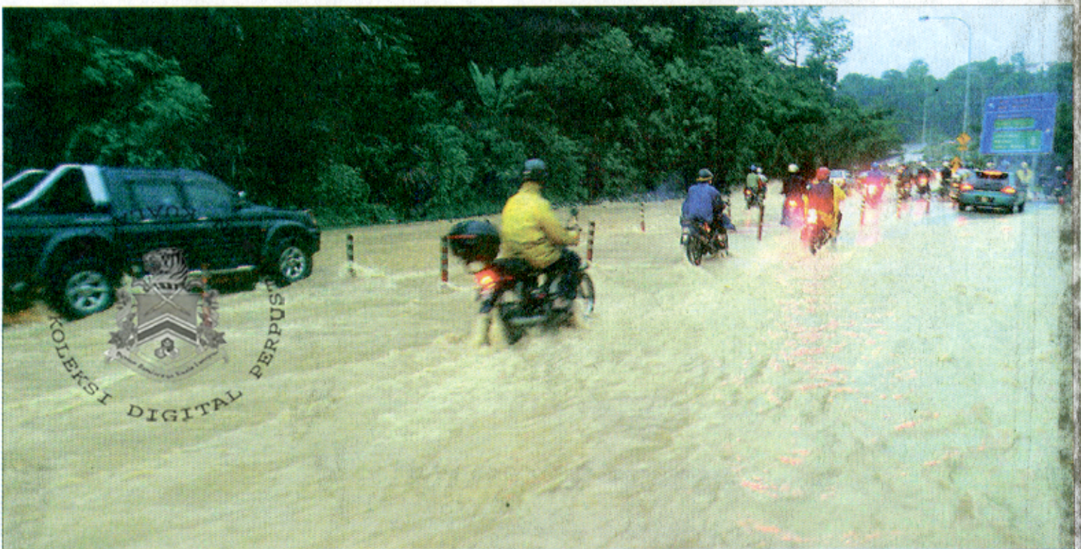
BANJIR kilat di sebahagian Jalan Duta memaksa penunggang motosikal berhati-hati mengharung arus yang deras.