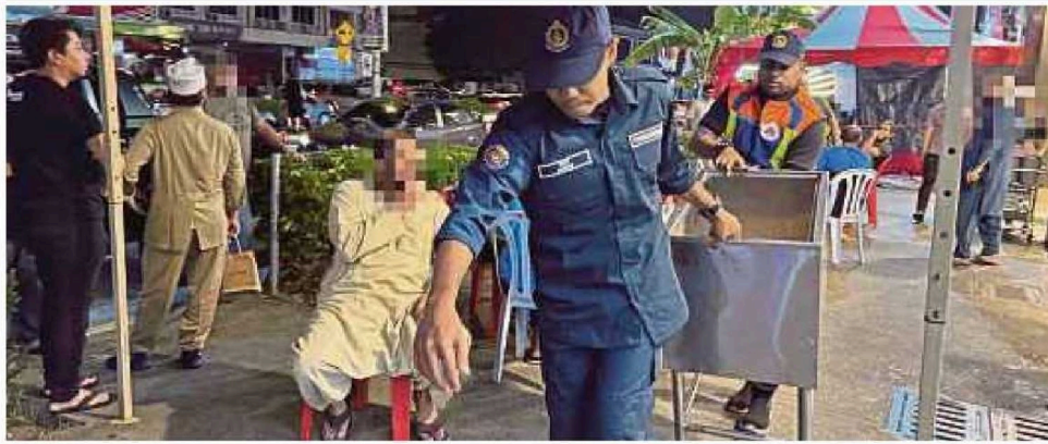
DBKL merampas barang perniagaan dan robohkan struktur perniagaan halang laluan.