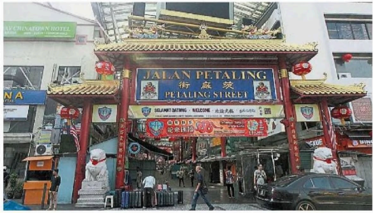
茨厂街全面提升及美化工程终于要在3月17日动工了。