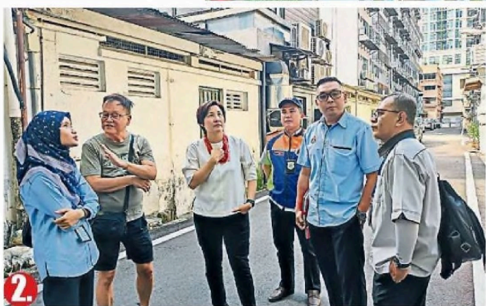
新就记路一栋荒废近10年的私人建筑后墙，长出一棵巨树，且树枝已逐渐伸向邻近建筑。