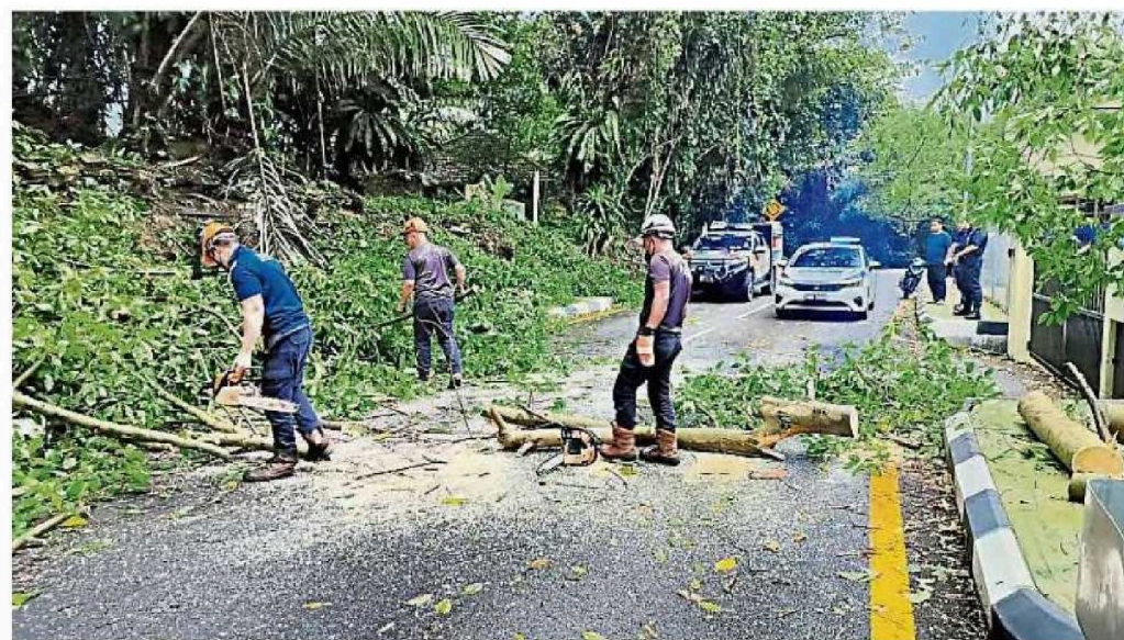
隆市局派员清除挡路的树干。

(八打灵再也12日讯) 狂风暴雨袭吉隆坡, 单单市中心就16处树倒! 午后一场暴风雨, 导致雪隆不少地区发生树倒、屋顶被破坏等事件, 最令人感到可怕的是, 单单在吉隆坡市中心, 就有高达16处发生树倒或树枝掉下的意外事故。