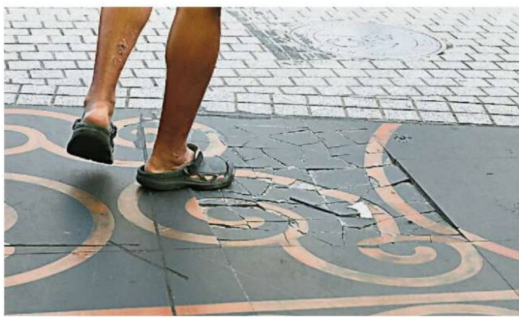
小贩希望市政局更换破损的瓷砖，改善地面凹凸不平的情况，避免民众不慎跌倒。

无论如何，大马将迎来旅游年，他们希望茨厂街在完成美化工程后，可以全新姿态迎接国内外游客。