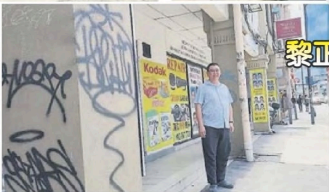
■ 为了避免地方被乱涂鸦,画家或艺术家就必须先向有关当局申请。