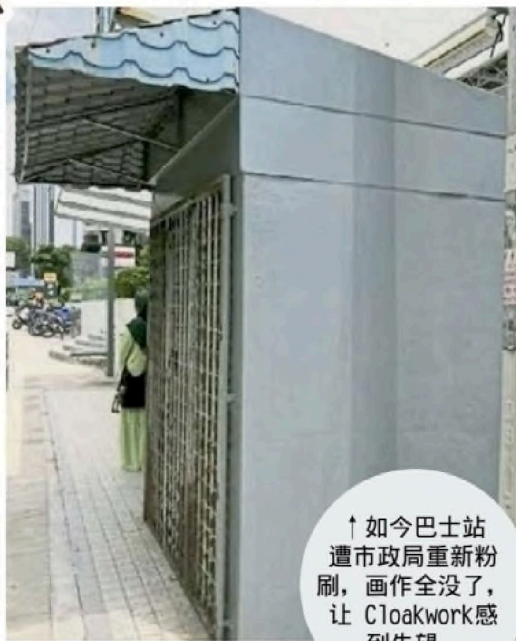
↑ 如今巴士站 遭市政局重新粉刷,画作全没了,让 Cloakwork 感到失望。