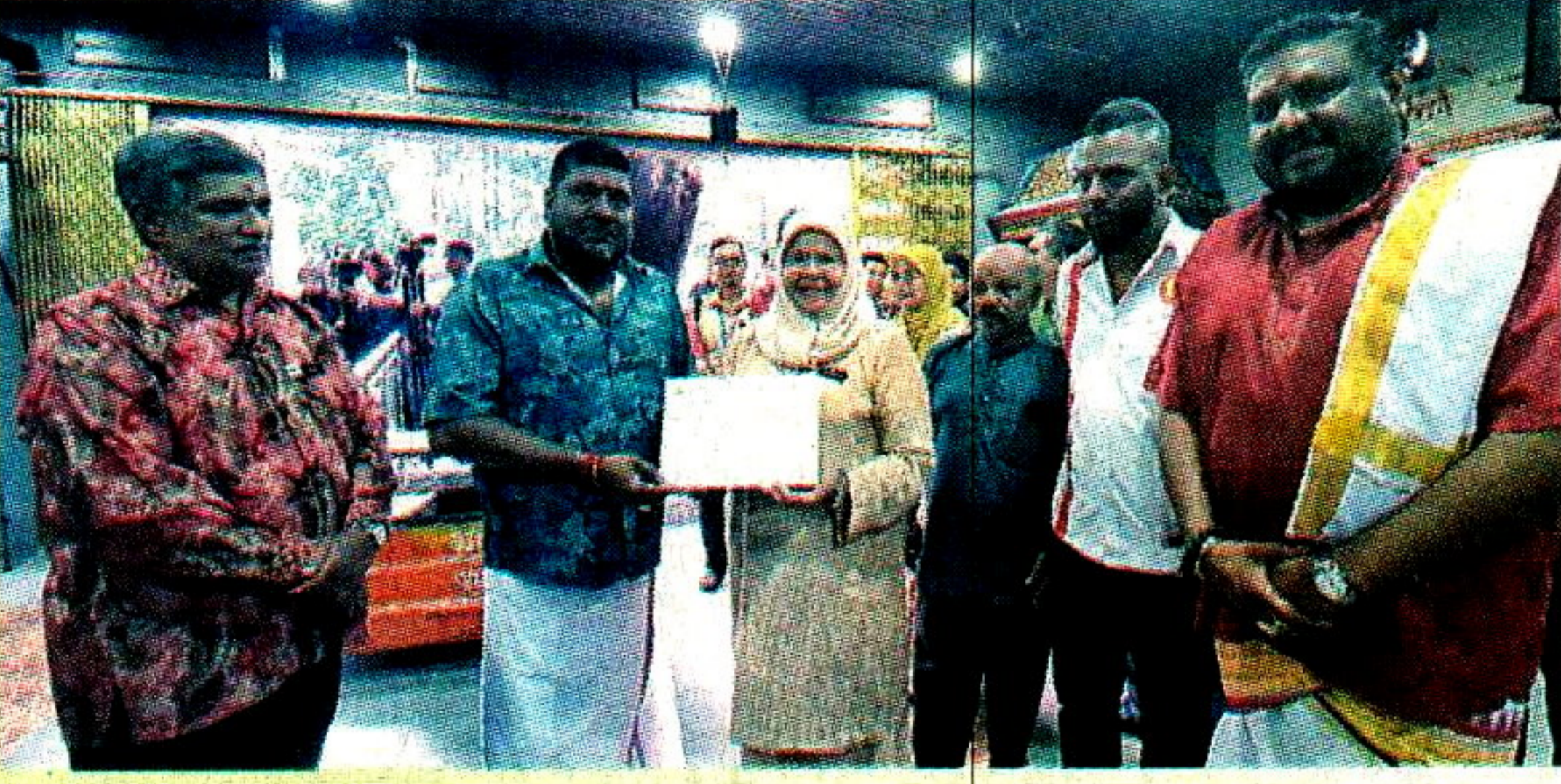
கோலாலம்பூர், மார்ச் 21 - நூற்றாண்டு காலம் பழைமை வாய்ந்த தேவி ஸ்ரீ பத்ர

காளியம்மன் ஆலயம் உடைக்கப்பட மாட்டாது என்று கோலாலம்பூர் மாநகர மன்றம் உறுதிமொழி வழங்கியிருக்கிறது. அந்த ஆலயத்தின் நிர்வாகம் மற்றும் இந்து பக்தர்களின் கோரிக்கைகள் முழுமையாக பரிசீலனை செய்யப்படும் என்றும் அது தெரிவித்தது.