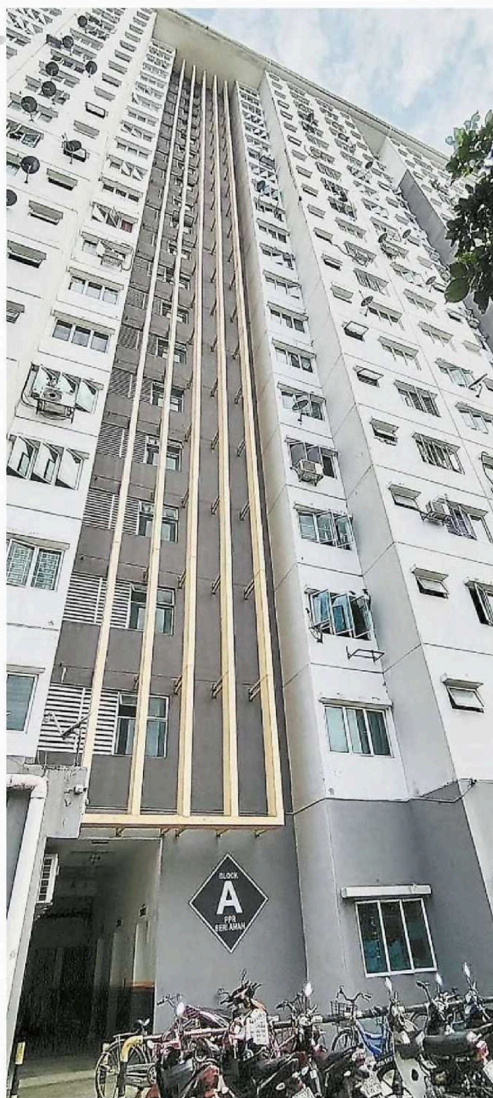
增江北区斯里阿曼人民组屋 (PPR Seri Aman) A座被指脏、乱、险！