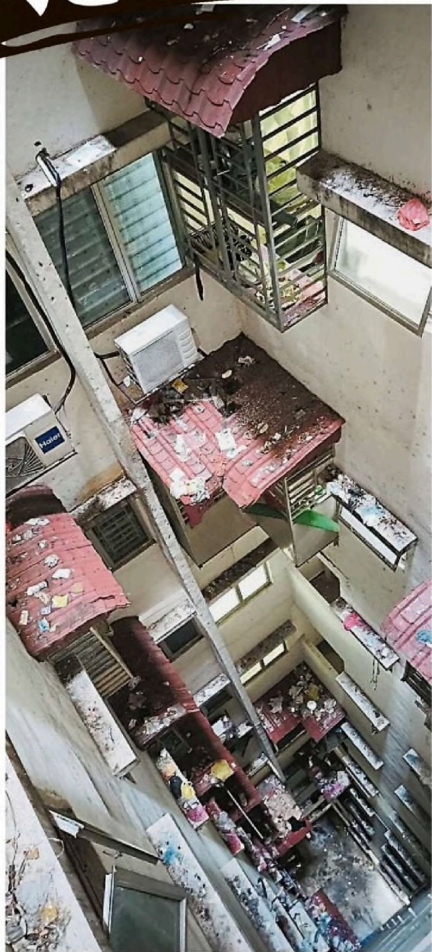
居民打包厨余垃圾，直接从窗口扔出天井，堆积如小山的垃圾腐烂发馊。