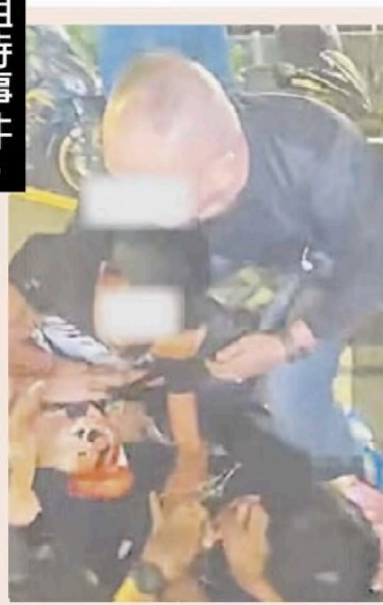
遭到执法员压制，气球小贩极力挣扎。

(吉隆坡29日讯) 吉隆坡市政局还原“执法人员被指向隆市东姑阿都拉曼路小贩动粗”事件经过，指是因无牌营业小贩多次忽视执法人员警告，拒绝配合且表现出攻击性推挤执法人员，才会爆发肢体冲突。