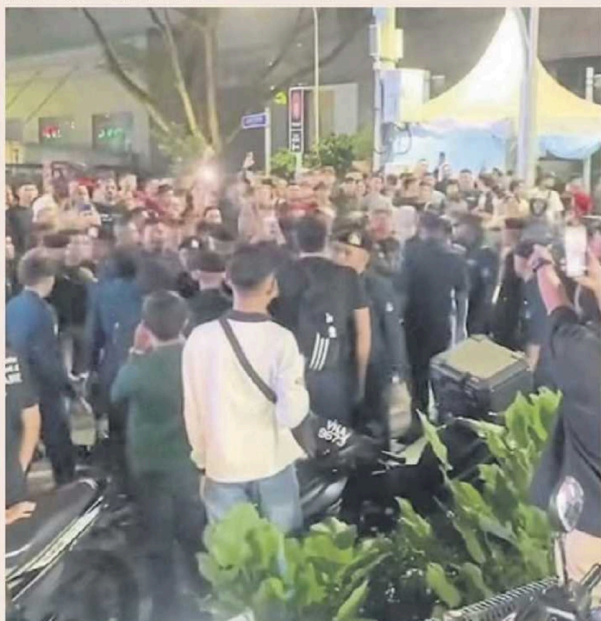
隆市东姑阿都拉曼路夜市周五(28日)发生骚动，引来许多人围观。

东兴港新村大会堂是于今年年初装修后，新的招牌只有单一语文即国语，经过各阵营的骂战后，大会堂于3月1日安装拥有中文、国语及淡米尔文的3D三语招牌，不料本月26再被更换成原有的单语白底黑字招牌，只保留大门入口处红底3D三语招牌。