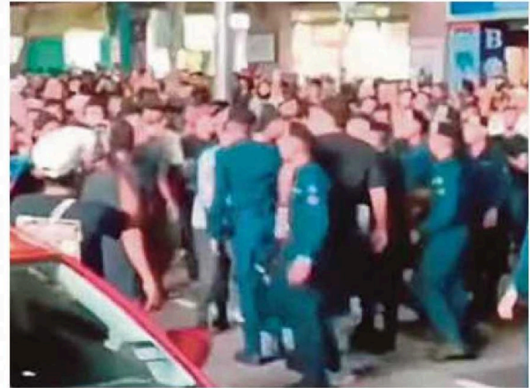
Tangkap layar kejadian peniaga 'rambo' menentang penguat kuasa DBKL di Jalan TAR.

DBKL, Ayob berkata, individu berkenaan dikatakan sudah diberi amaran sebanyak tiga kali.