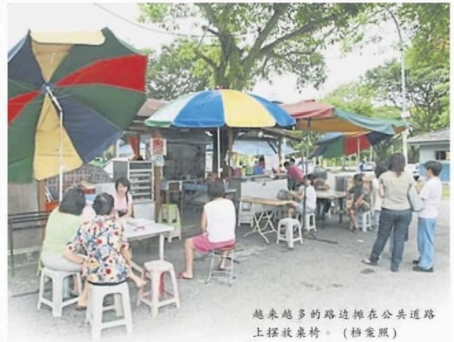
越来越多的路边摊在公共道路上摆放桌椅。(档案照)