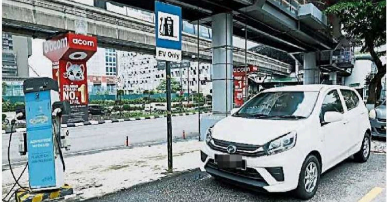
即便标明供电动车辆使用，还是用非该类轿车停放，市民担心提供便利的“限时停车格”也会遭到如此滥用。