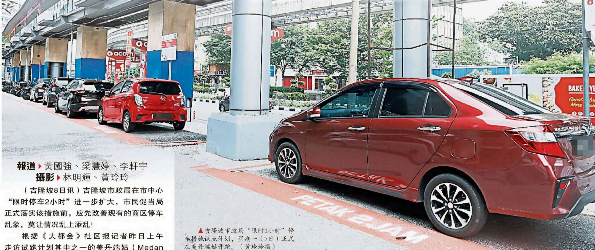
▲吉隆坡市政局“限时2小时”停车措施试点计划，星期一（7日）正式在美丹端姑开跑。