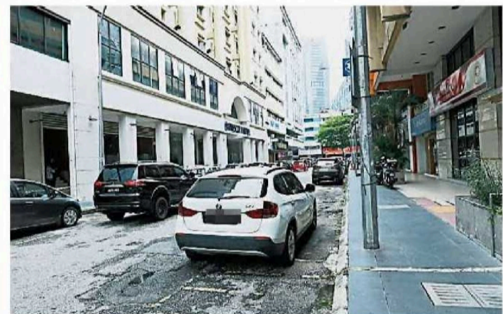
左图：美丹端姑商区数条街道有多个被商家长租的保留停车格。