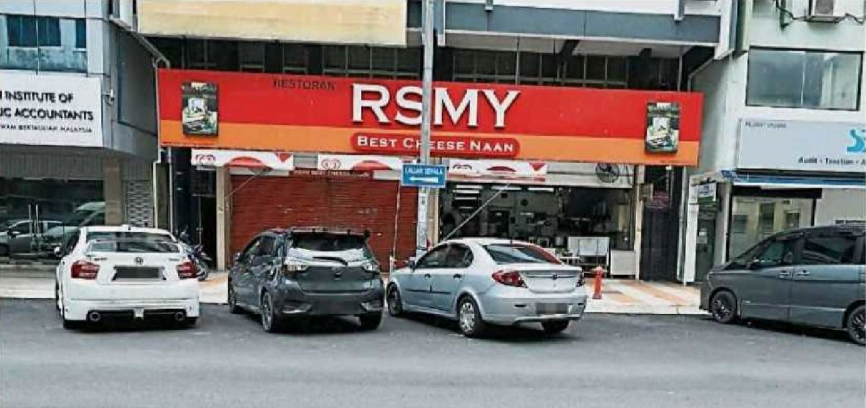
美丹端姑路商店前方进行了道路泊油重新铺设，却没有绘上新停车格线条。