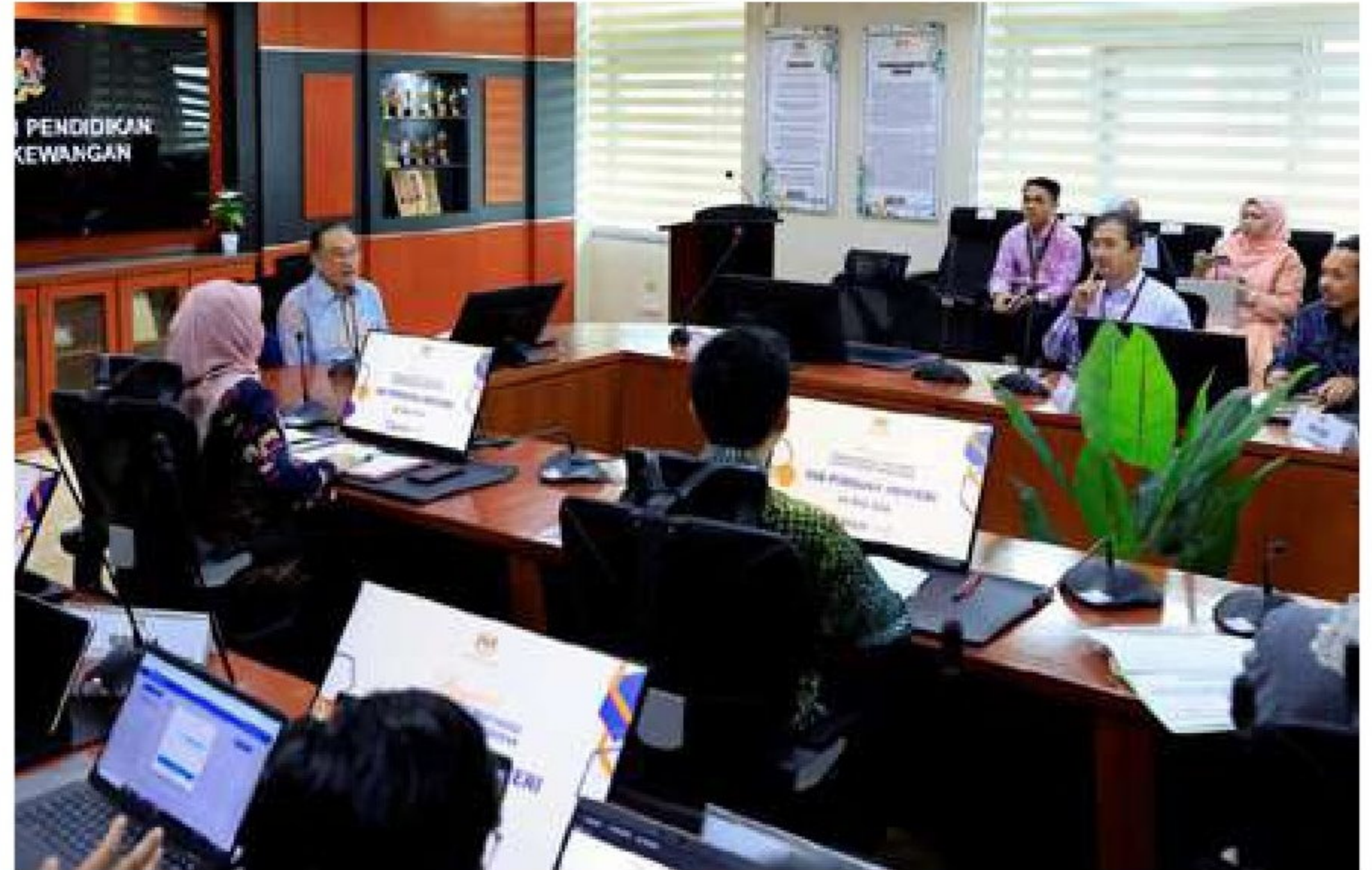
ANWAR mempengerusikan mesyuarat bersama Kementerian Pendidikan baru-baru ini.