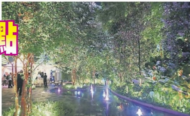
■艺术廊广场设计重点在於绿化、喷水装置和动态照明,主题为“光之演绎”。