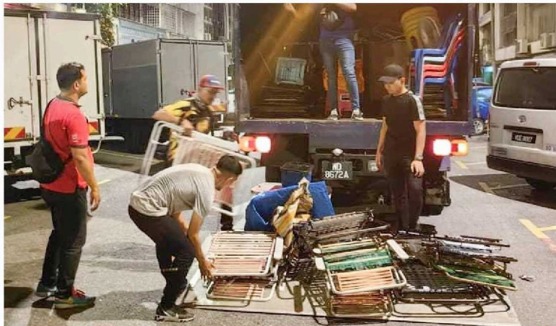
TINDAKAN agresif DBKL dan JIM dapat menghapuskan aktiviti penjajaan haram yang dilakukan warga asing.