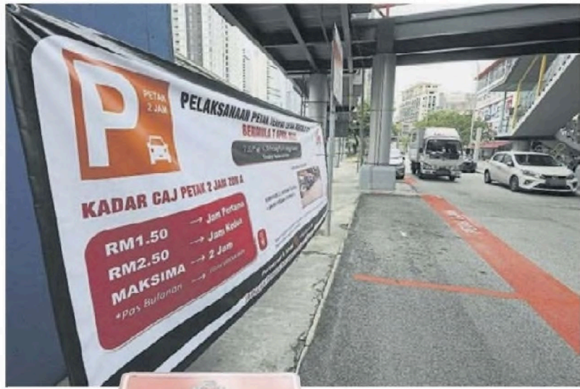
■横幅通知民众有关限时泊车计划的执行，张挂