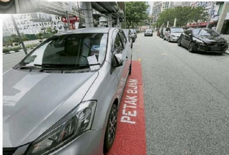
■尽管限时泊车位还在试跑阶段，执法人员已开罚单给违例车辆。

“车辆只能停泊2小时，也只能缴付最多2小时的泊车费，过了2小时就必须把车辆停在其他泊车位。”