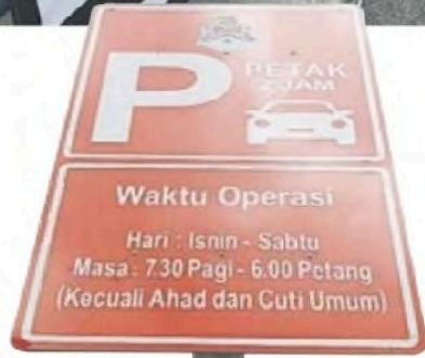
■辆只允许停泊最多2小时。市政局设立告示牌，注明车