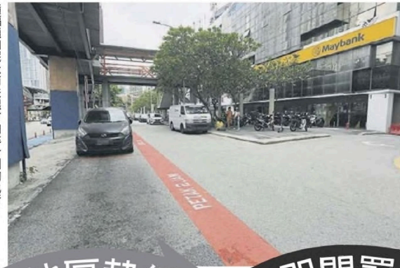
■限时泊车计划，都选在银行前。市政局于4月7日开始在2个地区落实