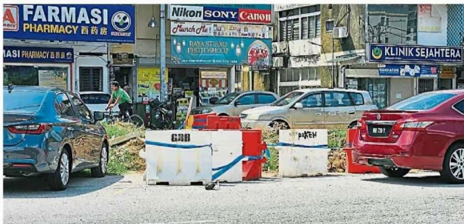
增江乌达玛路第一阶段拆迁违建与扩充道路的工作正如火如荼进行中。

（吉隆坡25日讯）因特定人士心怀不满的投诉，导致甲洞增江北區发展大蓝图第二阶段的违建商贩们提早接到吉隆坡市政局发出拆迁令，让路给提升工程，以致原有长达数个月的准备时间被压缩成14天，令商贩错愕又猝不及防。