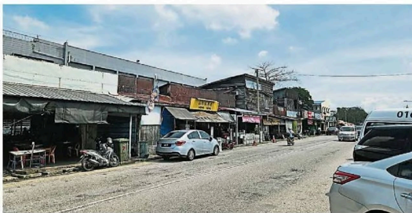
↑原来增江乌达玛路沿街的店铺最早可追溯回70多年前的英殖民年代，但基于属于违建又配合新巴刹兴建不得不令隆市政局命令搬迁及拆除。（黄国强摄）

→疑似遭到其他较早被令拆迁的商家恶意投诉，结果其余40多家违建店铺被连累，从数个月的宽限时间骤减成14天。（黄国强摄）