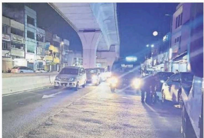
吉隆坡市政局祭狠招“封路执法”，漏夜封锁甲洞大街，拖走违例停泊路边的车子。

市政局昨晚大阵仗封路执法，在甲洞造成轰动，在场有民众摄下视频，上载至社交媒体面子书“甲洞人”群组，网民纷纷指食肆外面的车辆违停现象扰民已久，纷纷留言支持市政局的联合执法行动。