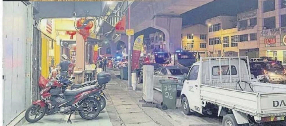
食肆顾客违例泊车在路边造成交通堵塞，市政局祭出“封路执法”狠招，与多个执法部门大阵仗封锁路段，拖走违停车辆。

業者：顧客屢勸不聽 屢勸顧客不要违例停泊却不受理，业者也表示无奈。 赖俊权建议业者在大街路边，竖立“禁止泊车”路牌提醒顾客，及聘用志愿警卫团人员(RELA)维持路段交通秩序。 食肆业者向赖俊权说，他一直都有提醒顾客，不要违例停泊大街路边，但顾客屢勸不听。 赖俊权呼吁甲洞大街的业者及商贩，切勿贪图自己业务方便，而对其他人造成妨碍，更不能为了生意而影响其他人。