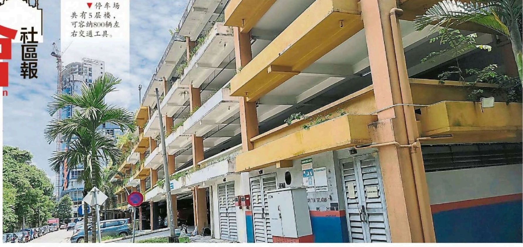
▼停車場共有5層樓，可容納800輛左右交通工具。