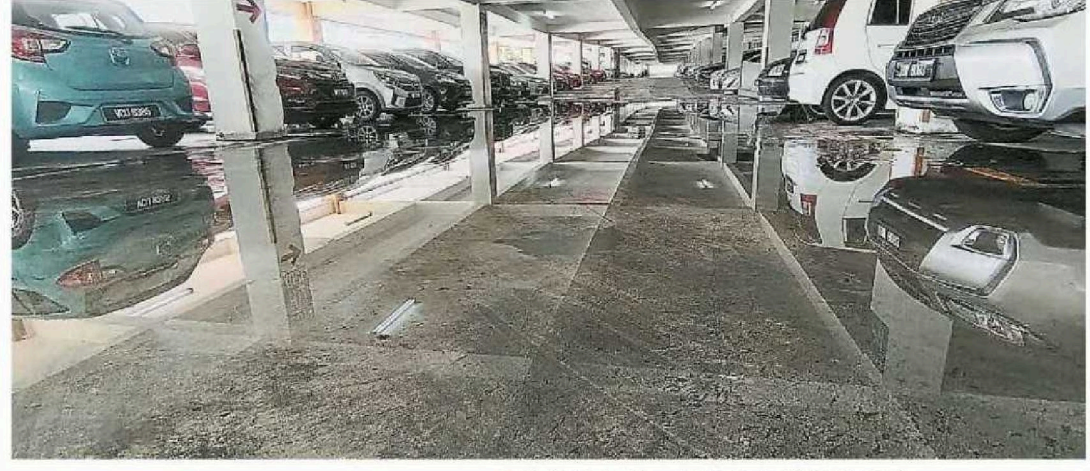
▲停車場積水，成了孳生繁衍的溫床。