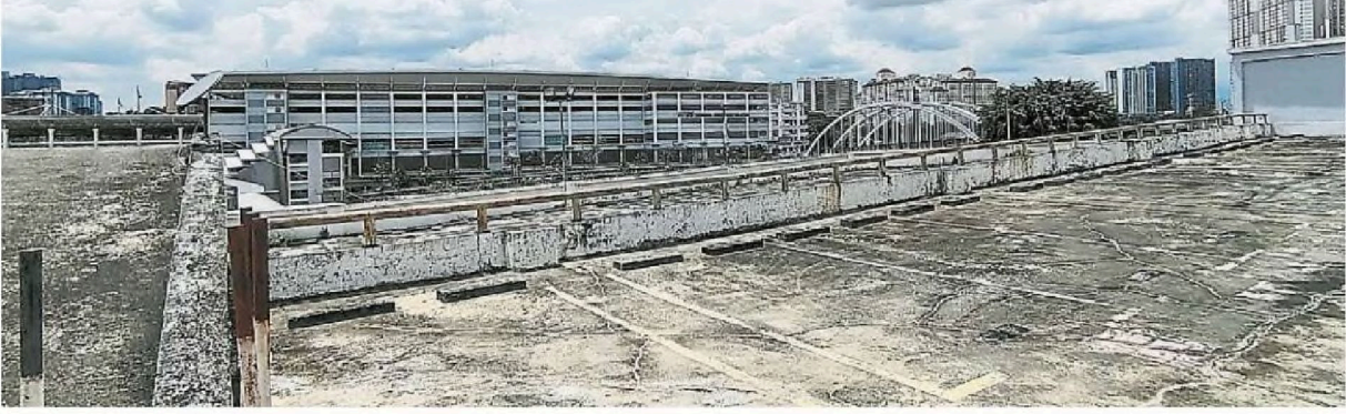
▲頂樓停車場一片蒼涼寂靜，沒人敢停車。