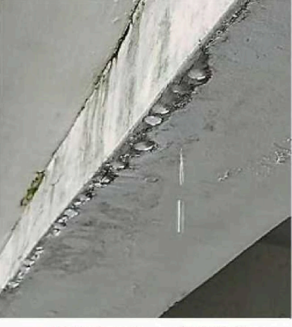
▲圓滾滾水珠，不斷滴答落下。