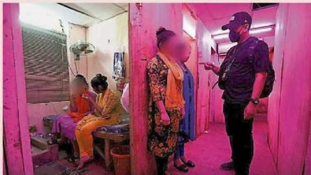
执法员检查疑似卖淫女子的身分。

（八打灵再也28日讯）茨厂街一带4处疑似经营卖淫活动的店铺，遭吉隆坡市政局执法组取缔，所有卖淫相关物品全被充公！