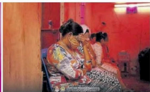
■ 被查获的女子静坐一旁，低头等待处置。