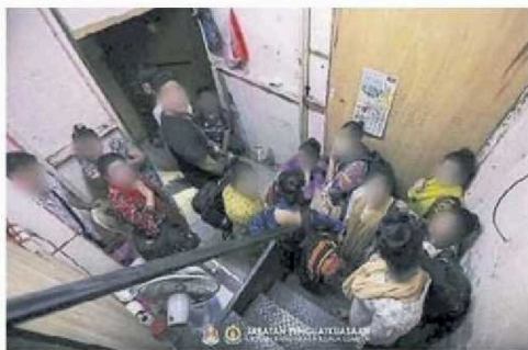
■ 吉隆坡市政局日前在茨厂街一带，展开取缔对付非法卖淫活动和场所。

些照片实际出自执法组的内部摄影师之手，只是此次采用了创新的拍摄手法。发言人也强调，市政局将持续加强打击非法娱乐场所的力度，同时欢迎市民通过正规渠道举报违法活动。