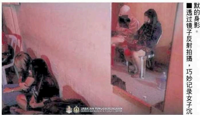
■ 默的身影。透过镜子反射拍摄，巧妙记录女子沉