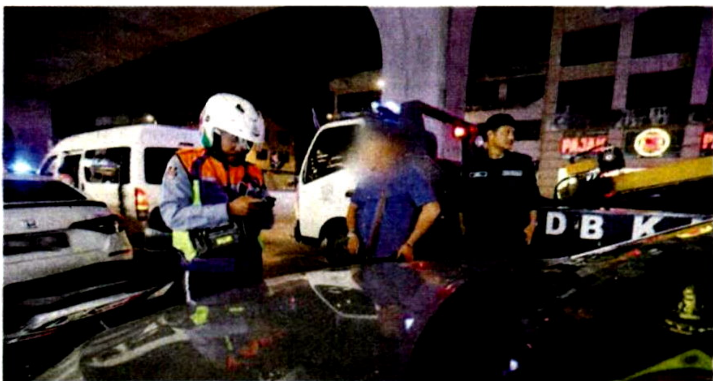
DBKL mengeluarkan 21 kompaun dan menunda sembilan kenderaan yang didapati melakukan kesalahan di sekitar ibu negara.

ke stor sitaan Jalan Lombong, Taman Miharja, Cheras, untuk rekod dan dokumentasi," katanya.