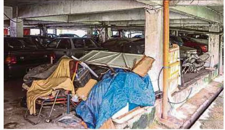
Tempat meletak kereta di Flat Taman Kuchai Jaya sering menjadi sasaran aktiviti jenayah.